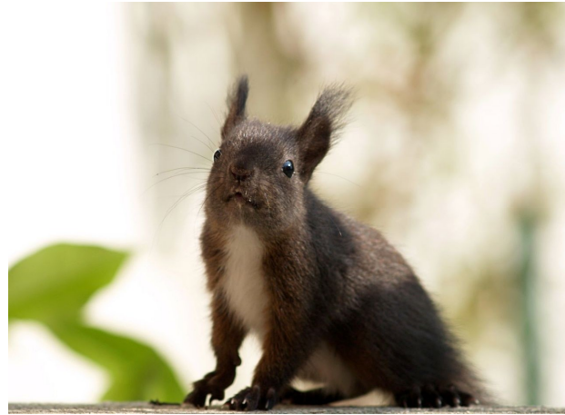
Obr. 5 Veverka obecná – rezavá forma. Obr. 6 Veverka obecná – hnědá forma.

Likvidace: Lze likvidovat odstřelem či odchytem do pastí. V místech, kde se nevyskytuje veverka obecná, lze použít i chemickou likvidaci (warfarin – používán ve Velké Británii, v Itálii zakázán). Z přirozených nepřátel připadají v Evropě v úvahu liška, kuna, dravci či větší sovy – tyto loví ve Velké Británii též introdukované veverky popelavé.