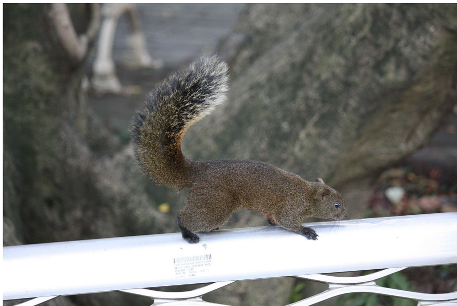
Obr. 4 Mohutný ocas s nádechem černé barvy.

Osidluje dřevinné biotopy (jehličnaté i listnaté lesy, sady, křoviny, městské parky). Domovský okrsek je malý (cca 0,5 ha u samic a 1,5 ha u samců). Jde o všežravce, hlavní zdroj potravy představuje rostlinná složka, dále si přilepšují houbami, hmyzem, či ptačími