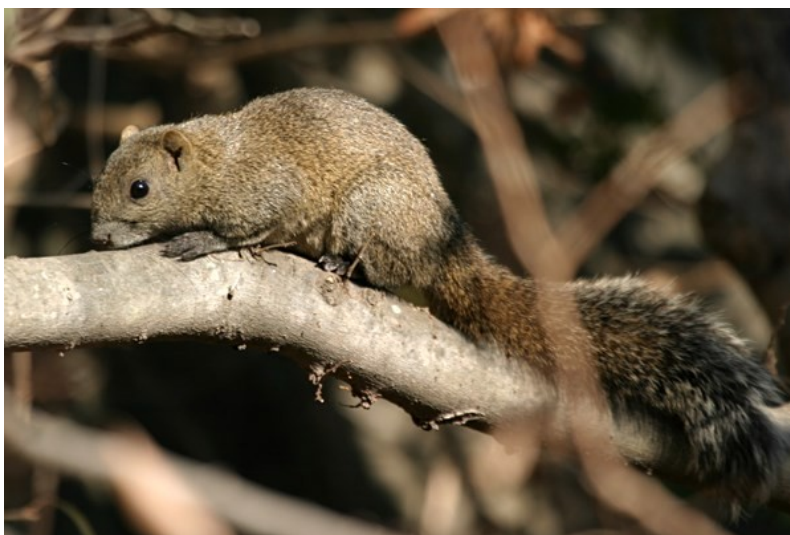
Obr. 1 Veverka Pallasova.

Původ: Domovina této veverky zahrnuje severovýchodní Indii, jižní Čínu, Myanmar, Thajsko, Vietnam, Tchajwan a pevninskou část Malajsie.