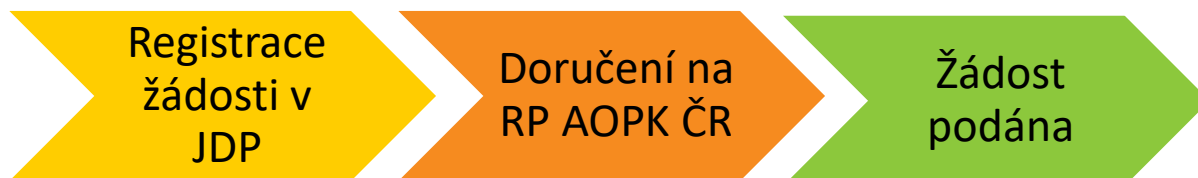
Obr. 1 – Kroky vedoucí k podání žádosti

Žadatel po registraci žádosti vygeneruje její tiskovou verzi ve formátu pdf a podepíše, čímž stvrdí čestná prohlášení a všechny skutečnosti uvedené v žádosti o dotaci. Ve lhůtě maximálně 5 pracovních dnů od registrace žádosti v JDP podepsanou tiskovou verzi žádosti (včetně všech příloh požadovaných dle kap. B.3 a příloh č. 3 a 4 této Příručky, které žadatel neuložil do JDP) doručí na AOPK ČR. Pokud je vytištěná žádost doručena osobně anebo poštou, bude žadatelem podepsána fyzicky. Žádost lze doručit i datovou schránkou (dále jen „DS“). V případě doručení žádosti e-mailem bude žádost podepsána kvalifikovaným elektronickým podpisem. Žádost je považována za podanou v momentě doručení na AOPK ČR.